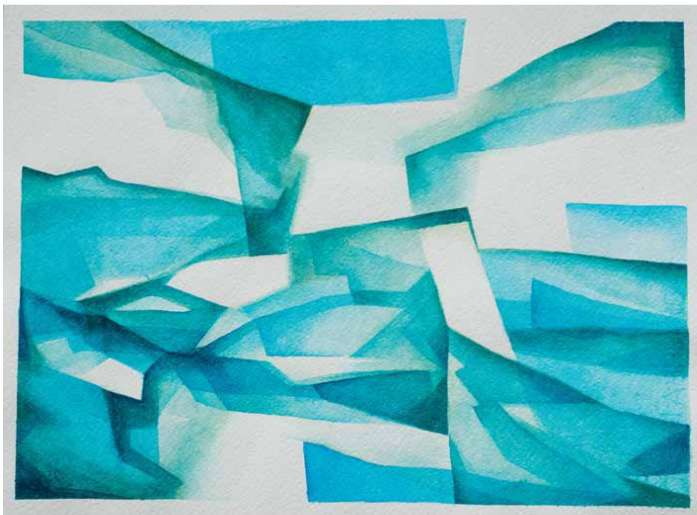
Ivan Bogović, Bez naziva , 28 x 38 cm, akvarel na papiru, 2019.