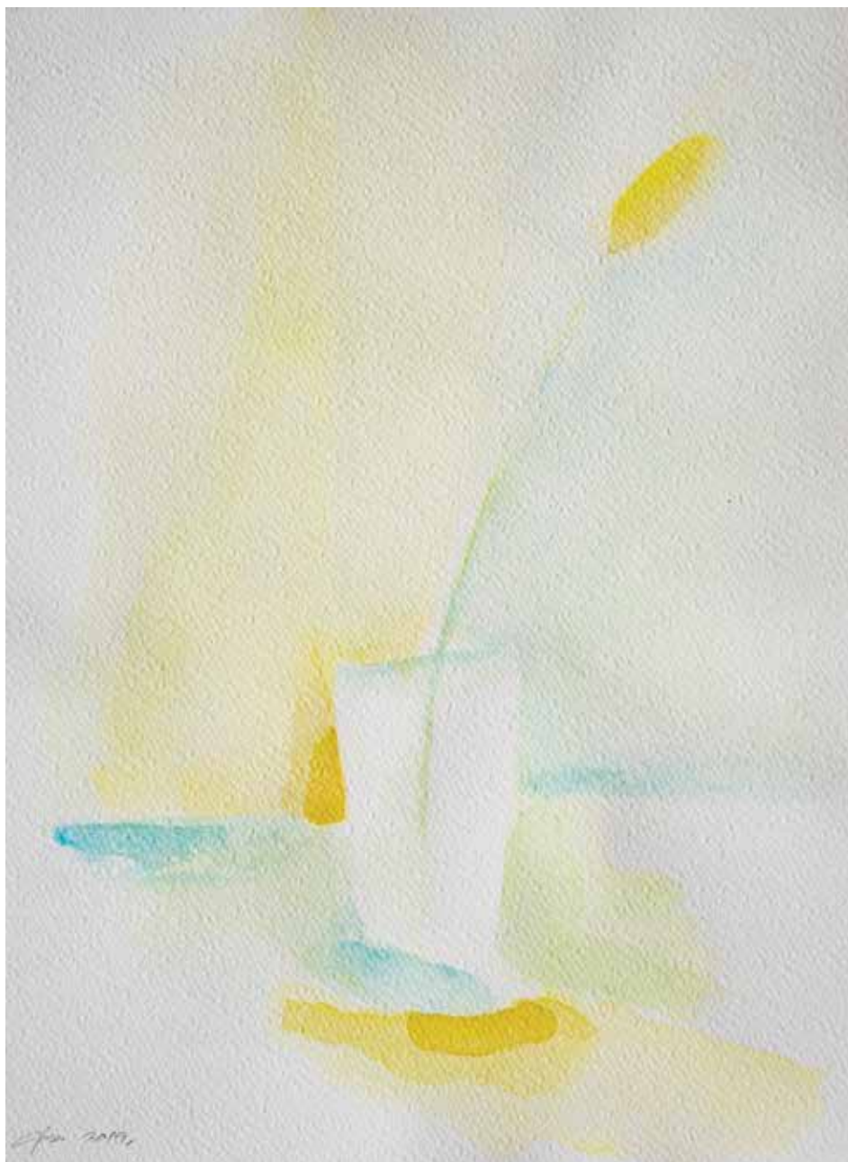
Dejan Duraković, Prizor I , 27x 37 cm, akvarel na papiru, 2019.