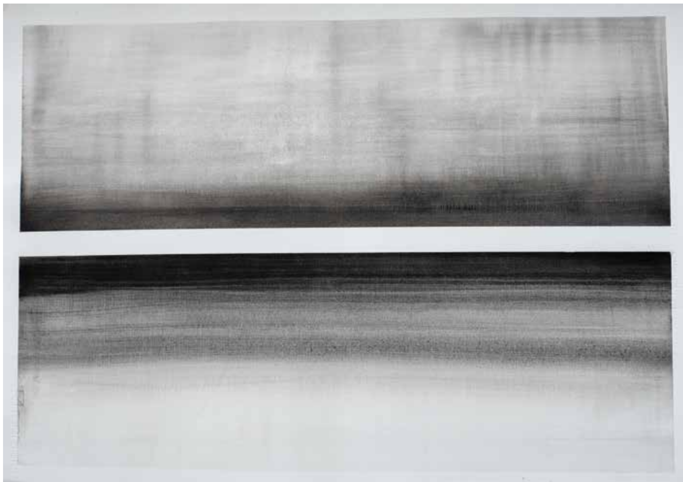
Ivana Škvorčević, Film bez kamere , 70 x 50 cm, akvarel na papiru, 2019.