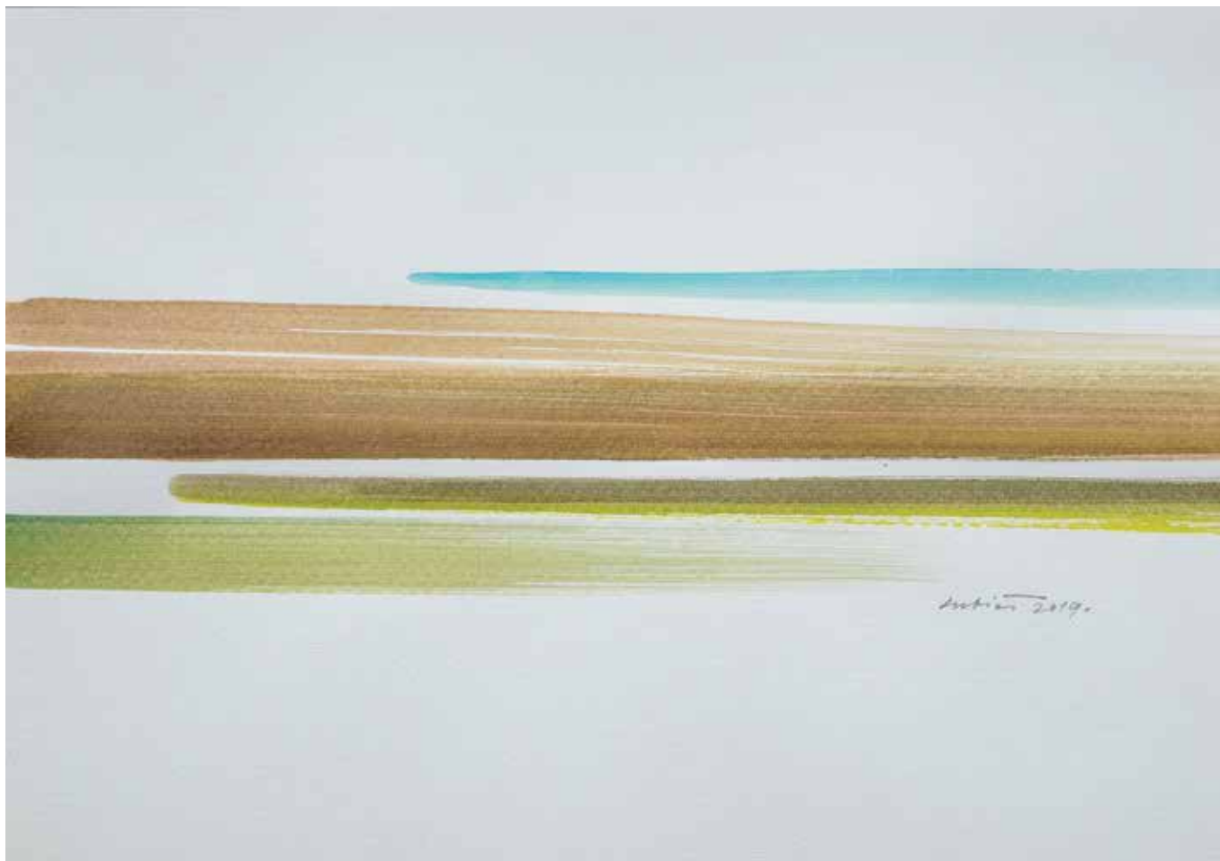
Željko Subić, Lice ravnice III , 35 x 50 cm, akvarel na papiru, 2019.