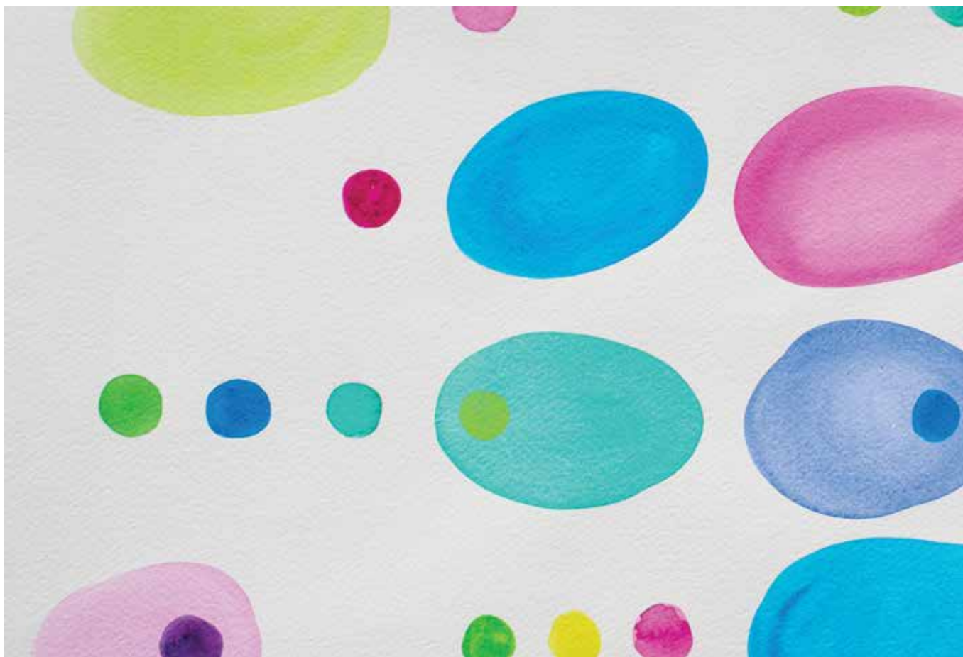
Iva Habus, Kompozicija , 38 x 56 cm, akvarel na papiru, 2018.