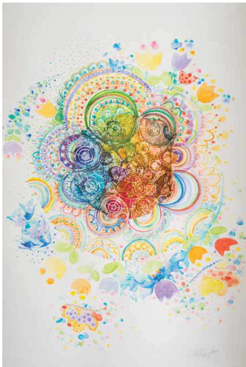
Irena Zeiner, Osunčana čipka , 75 x 52 cm, akvarel na papiru, 2019.