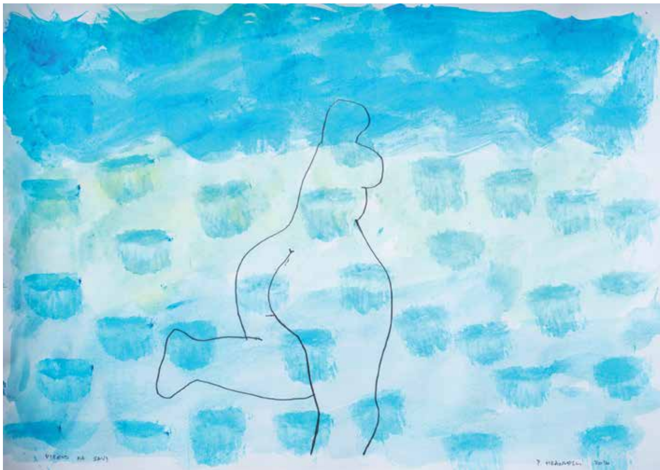
Petar Hranuelli, Vikend na Savi , 50 x 71 cm, akvarel na papiru, 2018.