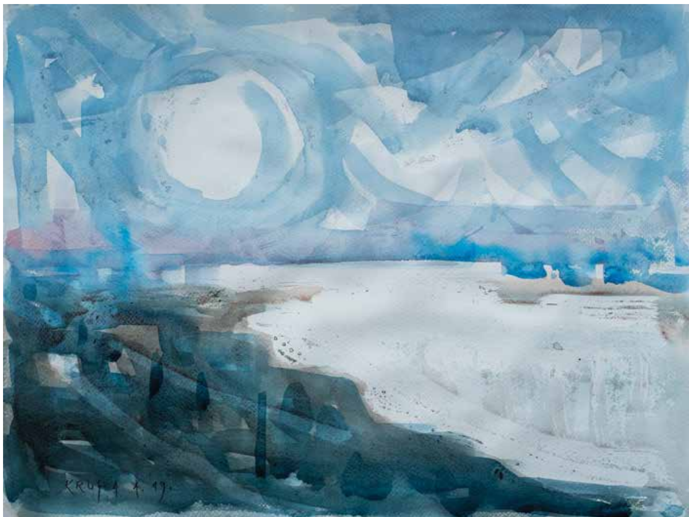
Alfred Freddy Krupa, Sanjarenje , 36 x 48 cm, akvarel na papiru, 2019.