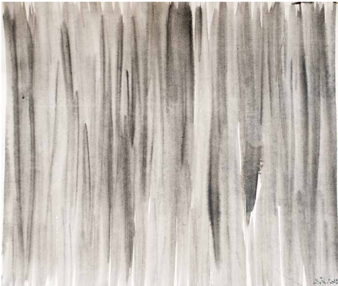
Josipa Čamber, Kiša , 35 x 42 cm, akvarel na papiru, 2019.