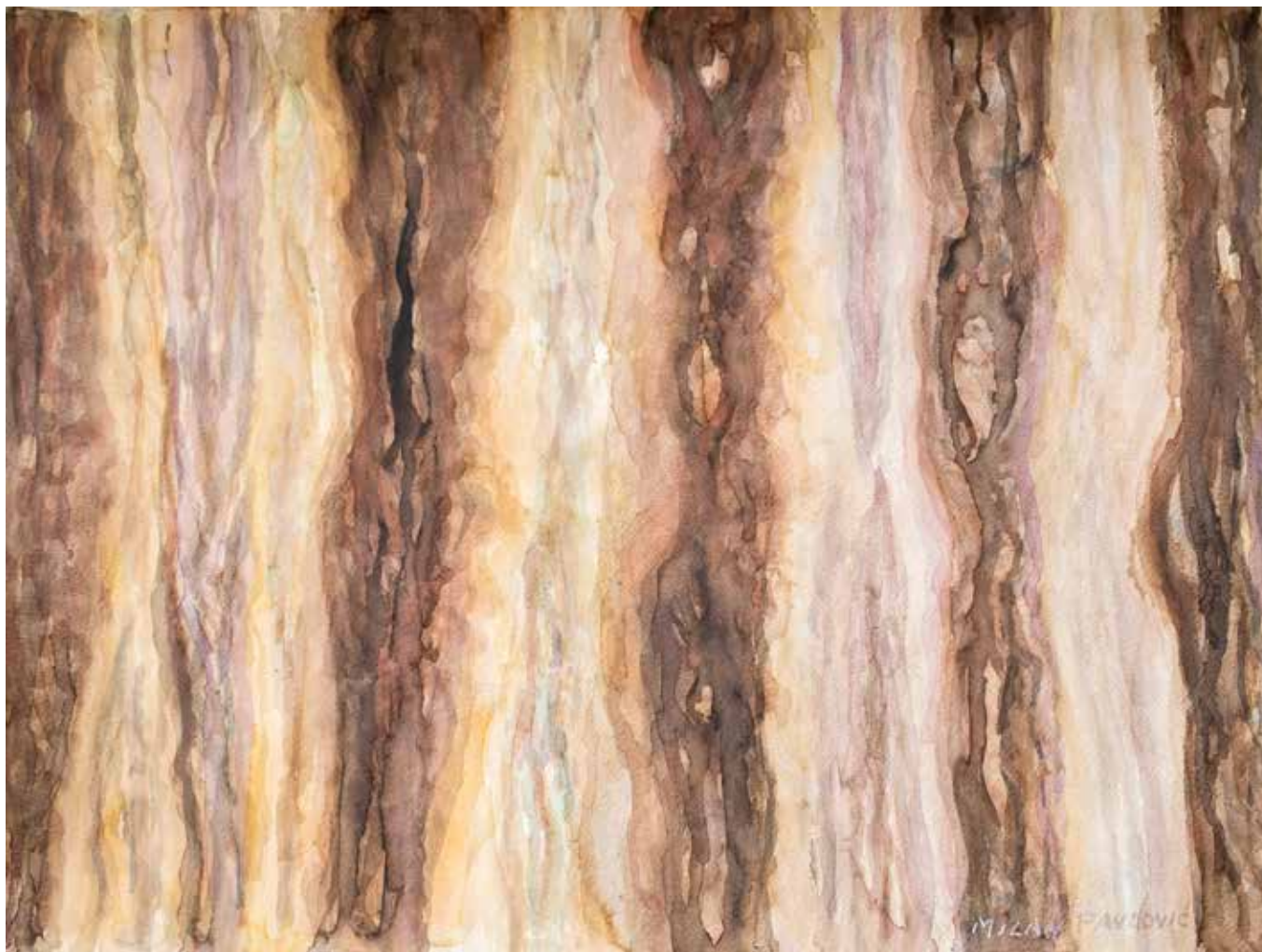
Milan Pavlović, Kore , 56x 76 cm, akvarel na papiru, 2019.