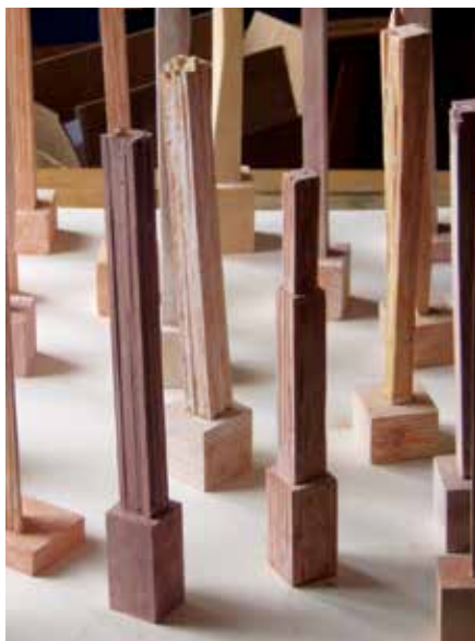
IZ CIKLUSA "ŠAH, MAT, LAK", 2010. drvo, različite dimenzije (od 250-316 cm)