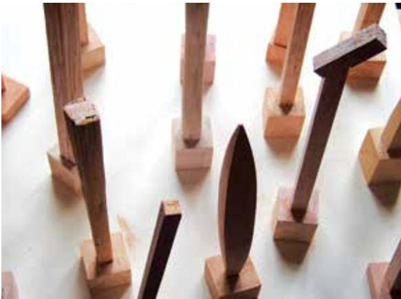
IZ CIKLUSA "ŠAH, MAT, LAK", 2010. drvo, različite dimenzije (od 250-316 cm)