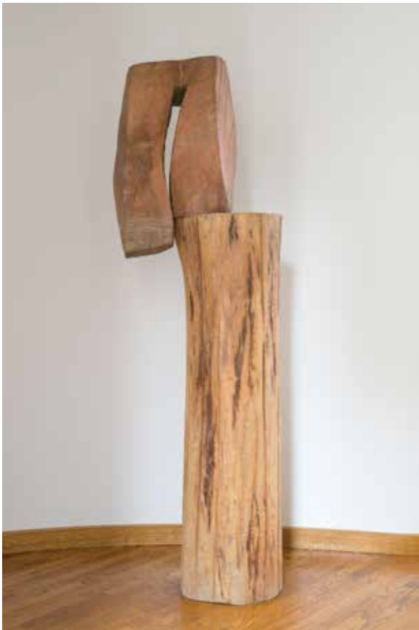
SENCA FINE , 1986. drvo, v. 200 cm