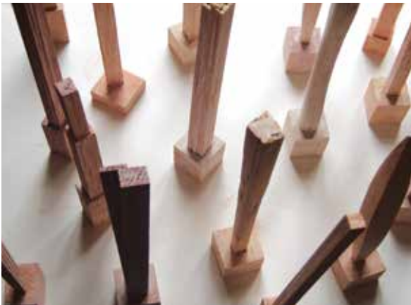
IZ CIKLUSA "ŠAH, MAT, LAK", 2010. drvo, različite dimenzije (od 250-316 cm)