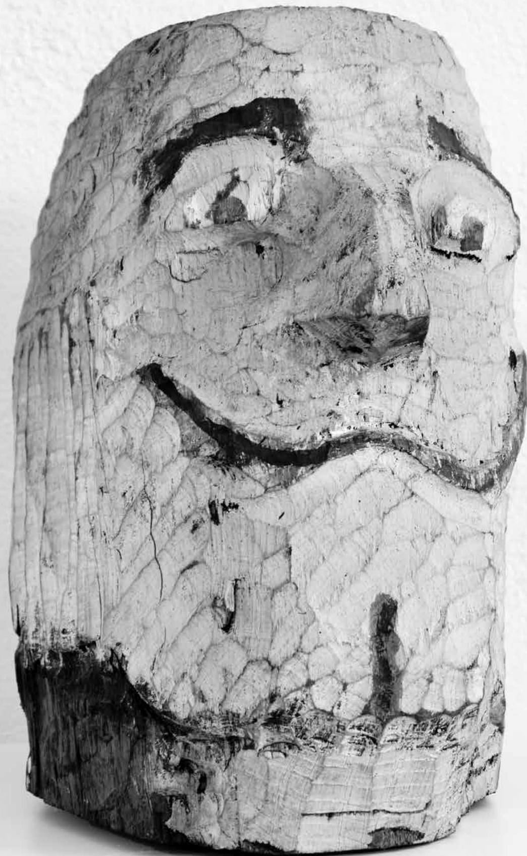
DALÍ, 1988., drvo, vis. 33 cm