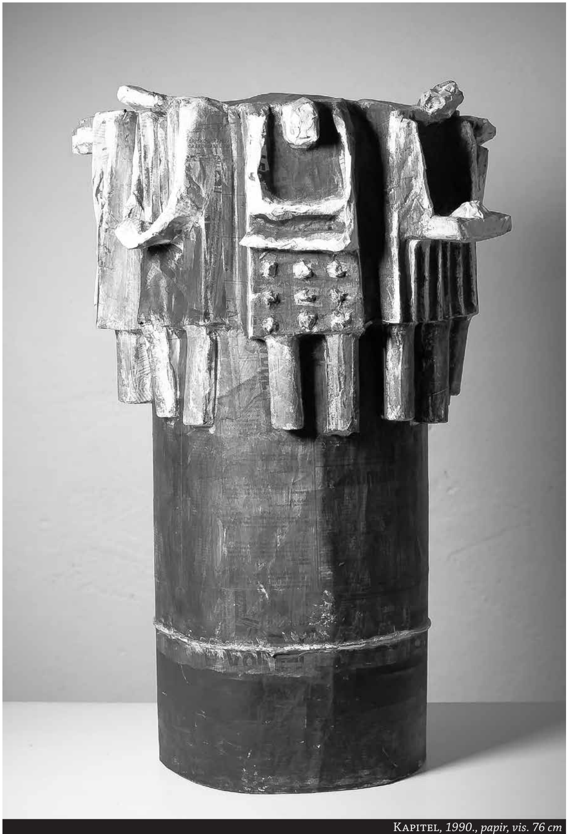
KAPITEL, 1990., papir , vis. 76 cm