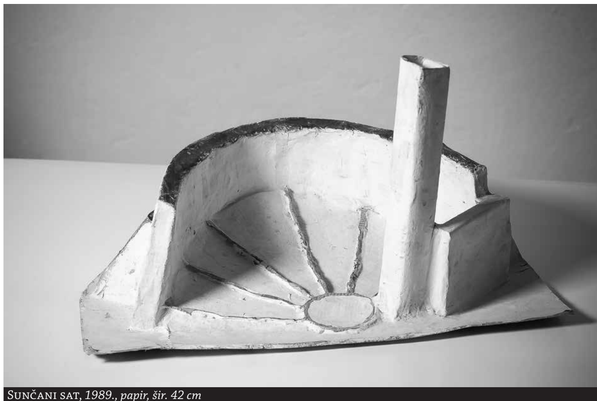
SUNČANI SAT, 1989., papir, šir. 42 cm