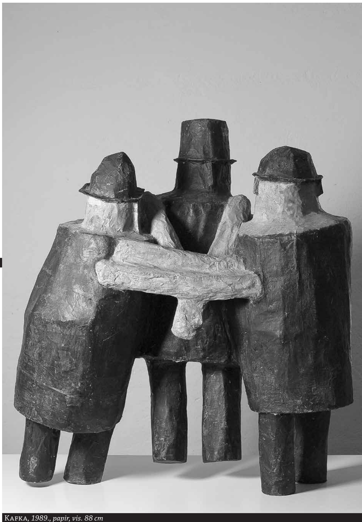
KAFKA, 1989., papir, vis. 88 cm