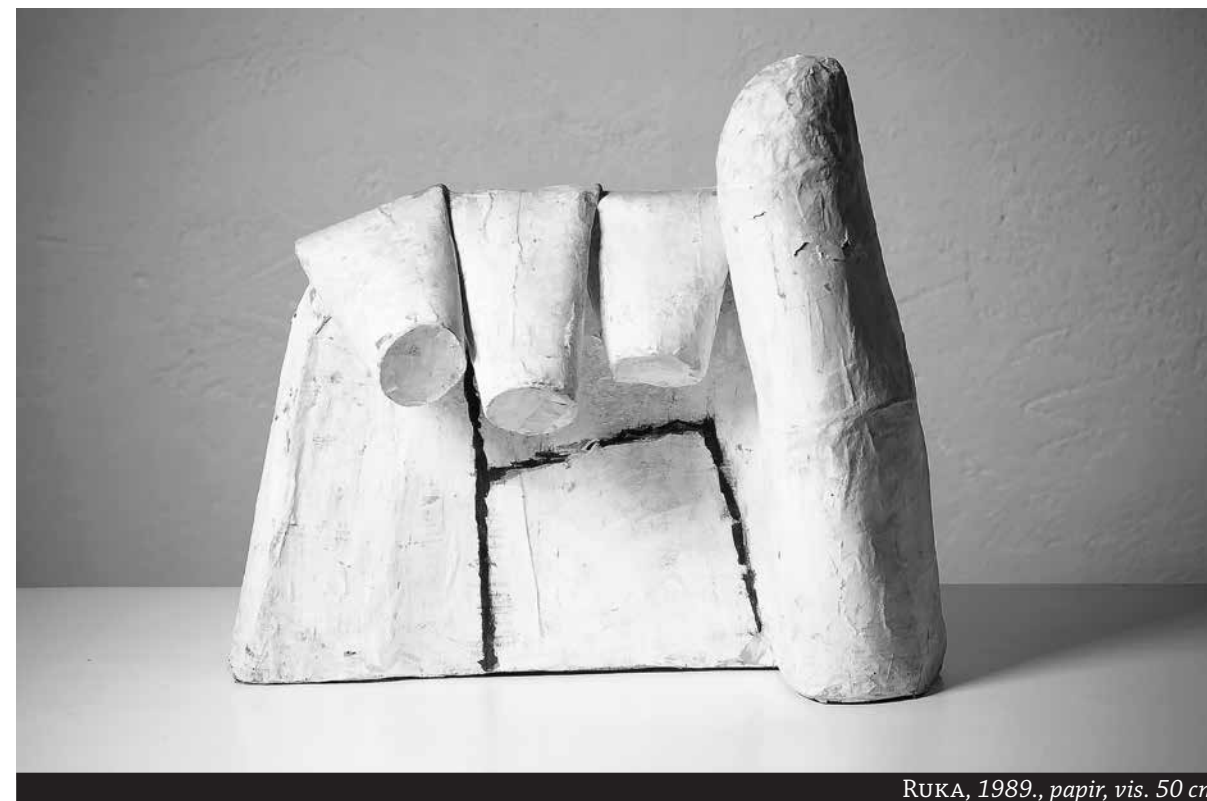
RUKA, 1989., papir, vis. 50 cm