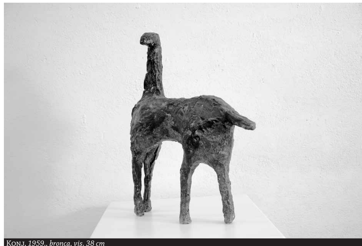
KONJ, 1959., bronca, vis. 38 cm