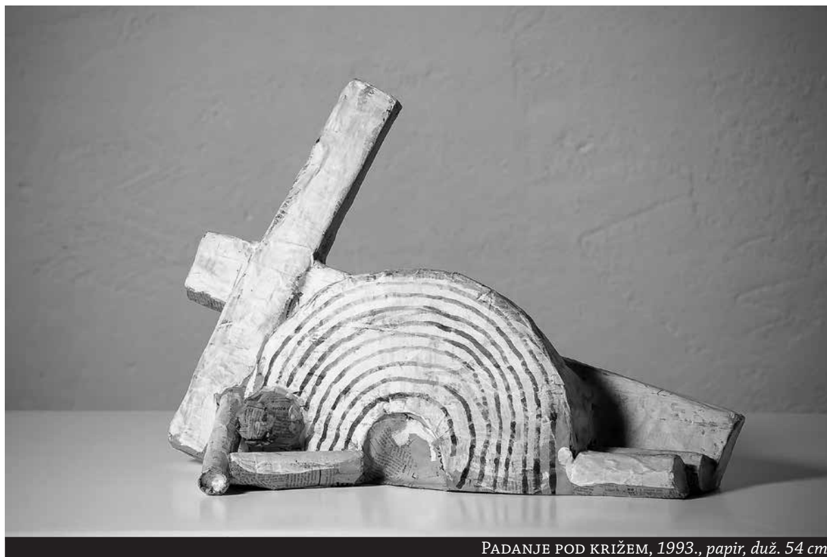
PADANJE POD KRIŽEM, 1993., papir, duž. 54 cm

Upravo u ovom materijalu Ružić uspijeva u potpunosti provesti u djelo svoju često ponavljajuću tezu „sve je skulptura“. Sve što je vidio oko sebe bilo je dovoljno zanimljivo i vrijedno da bi se oblikovalo u skulpturi. Iako smo potvrdili te njegove teze vidjeli i ranije, u skulpturama nastalim u drvu i terakoti, ovdje je ona doživjela kulminaciju. Ponegdje je iskoristio prpošnost i lakoću papira kako bi prikazao vedre teme: Čaplje, Sunčani sat, Ruku, pa čak i Kišu (nad Rovinjem). Drugdje je iskoristio dramatičnu igru sjene u oštrim lomovima papira kako bi istakao stradanje (Križ, Padanje pod križem).