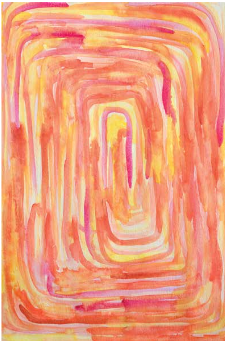
Frane Rogić, U Pošti , akvarel na papiru, 45 x 30 cm, 2016.