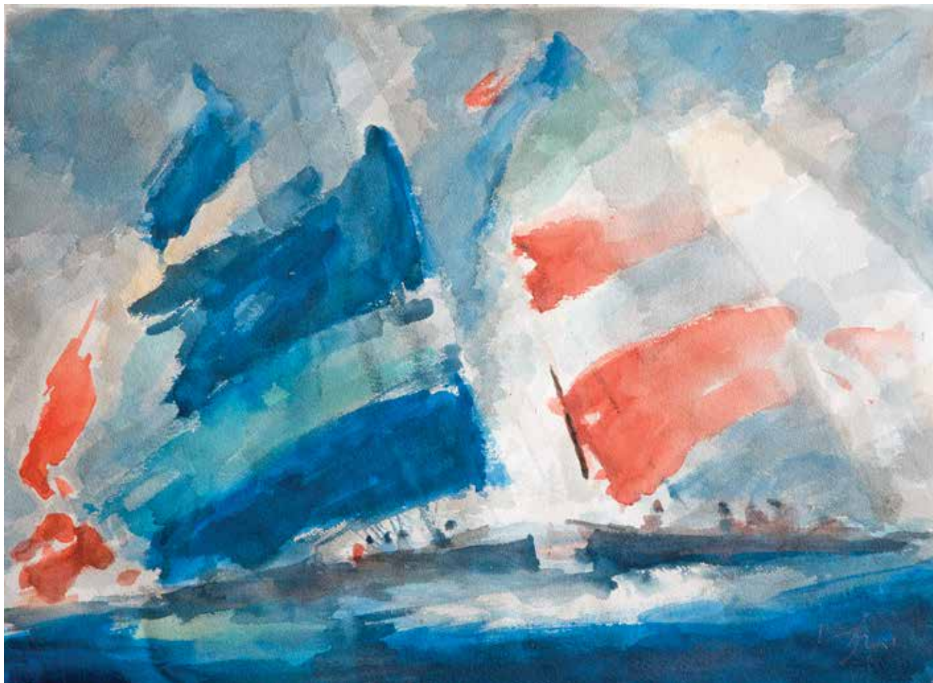
Mato Jurković, Jedra , akvarel i gvaš na papiru, 55 x 76 cm, 2015.