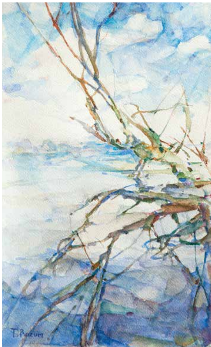
Tihomir Razum, Obala , akvarel na papiru, 48 x 30 cm, 2016.