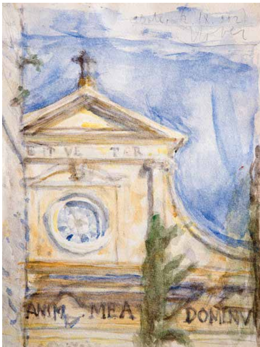
Igor Zlobec, Crkva u Balama , akvarel na papiru, 34,5 x 49 cm, 1992.