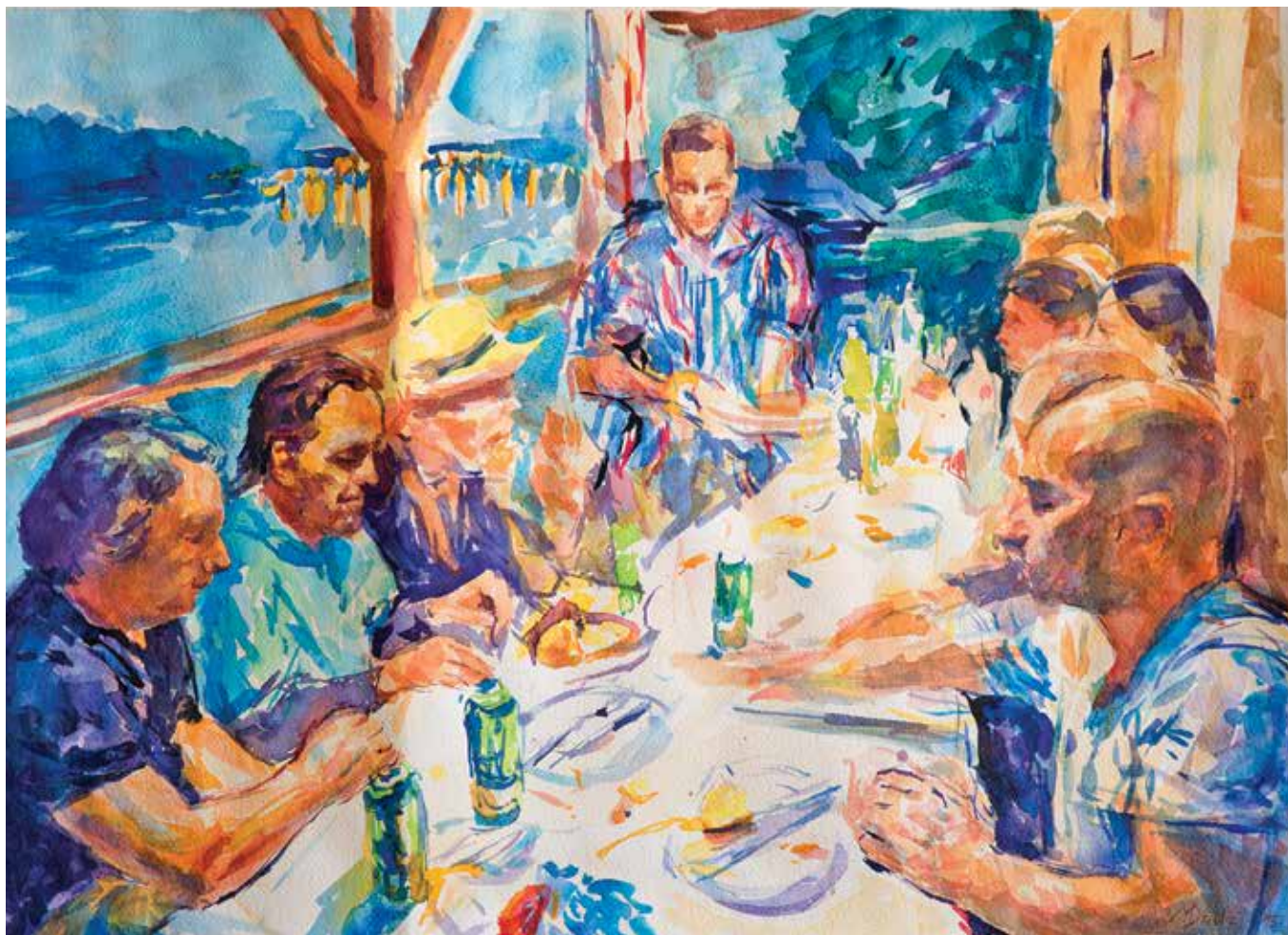
Mihovil Dorotić, Sudionici 36. saziva kolonije , akvarel na papiru, 34,5 x 49 cm, 2015.