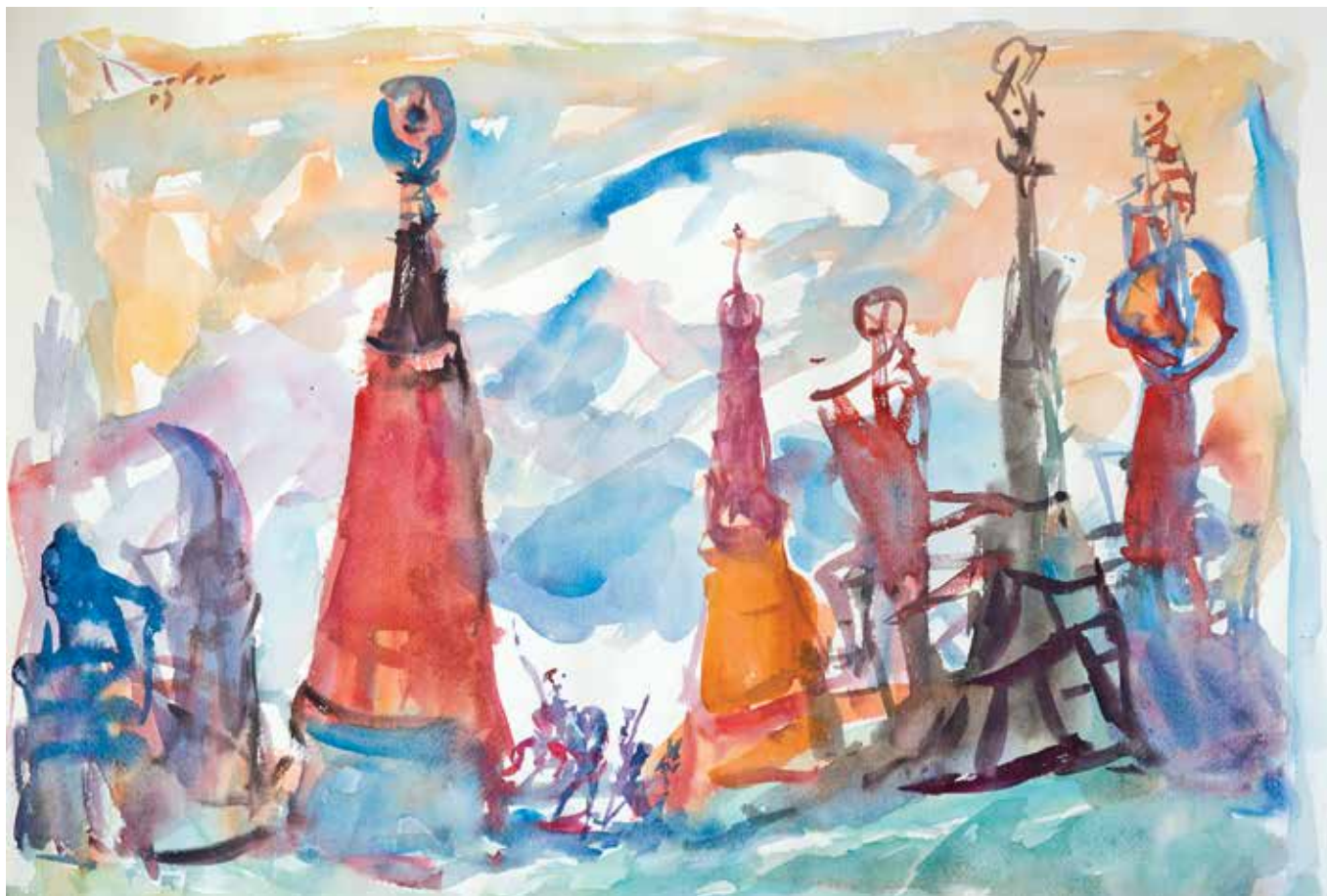
Davorin Radić, Čuvari , akvarel na papiru, 45 x 61 cm, 2016.