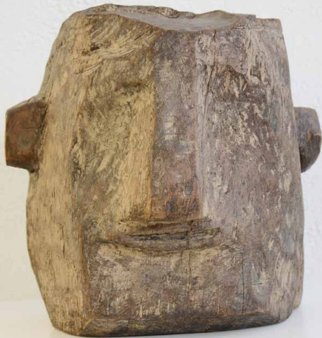
AUTOPORTRET I, 1971, drvo, vis. 30 cm

veliko iznenađenje kao kad bi se netko probudio pa bi znao francuski. Pa taj bi samo cijeli dan govorio francuski. Tako sam ja odjedanput progovorio jedan jezik i tim sam jezikom pokušao obnoviti cijeli svoj svijet.