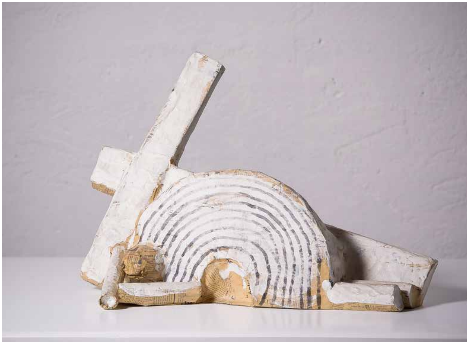
PADANJE POD KRIŽEM, 1993, papir, duž. 54 cm