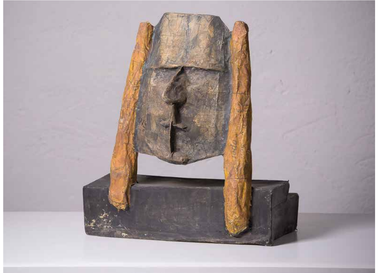
OGLEDALCE, 1989, papir, vis. 44 cm