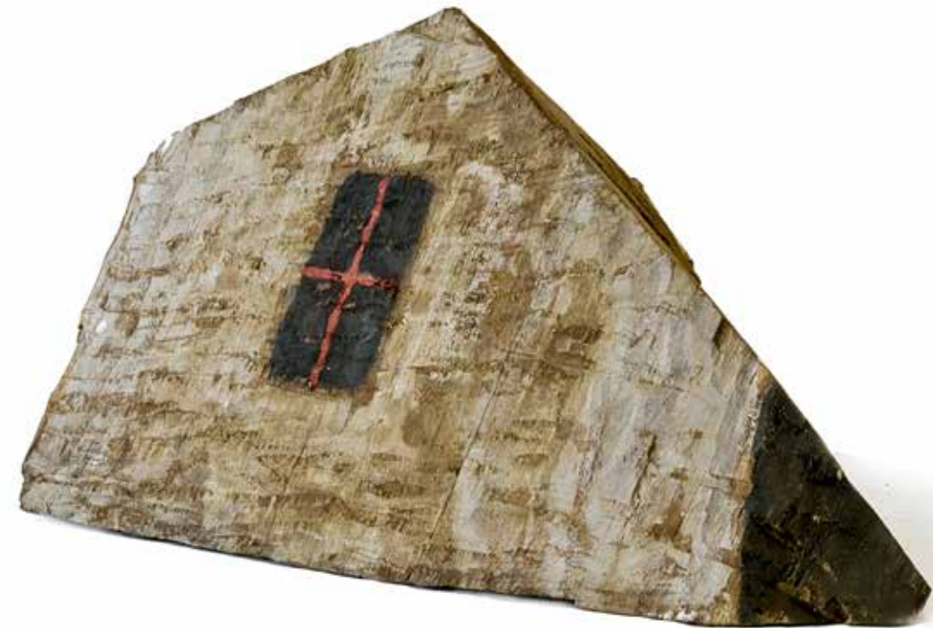
CRNA 1993. drvo, vis. 46 cm