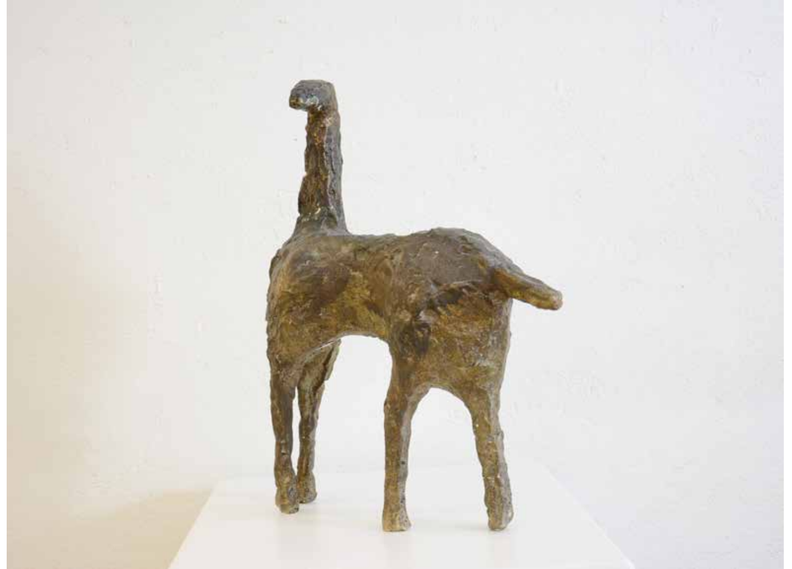
KONJ, 1959, bronca, vis. 38cm