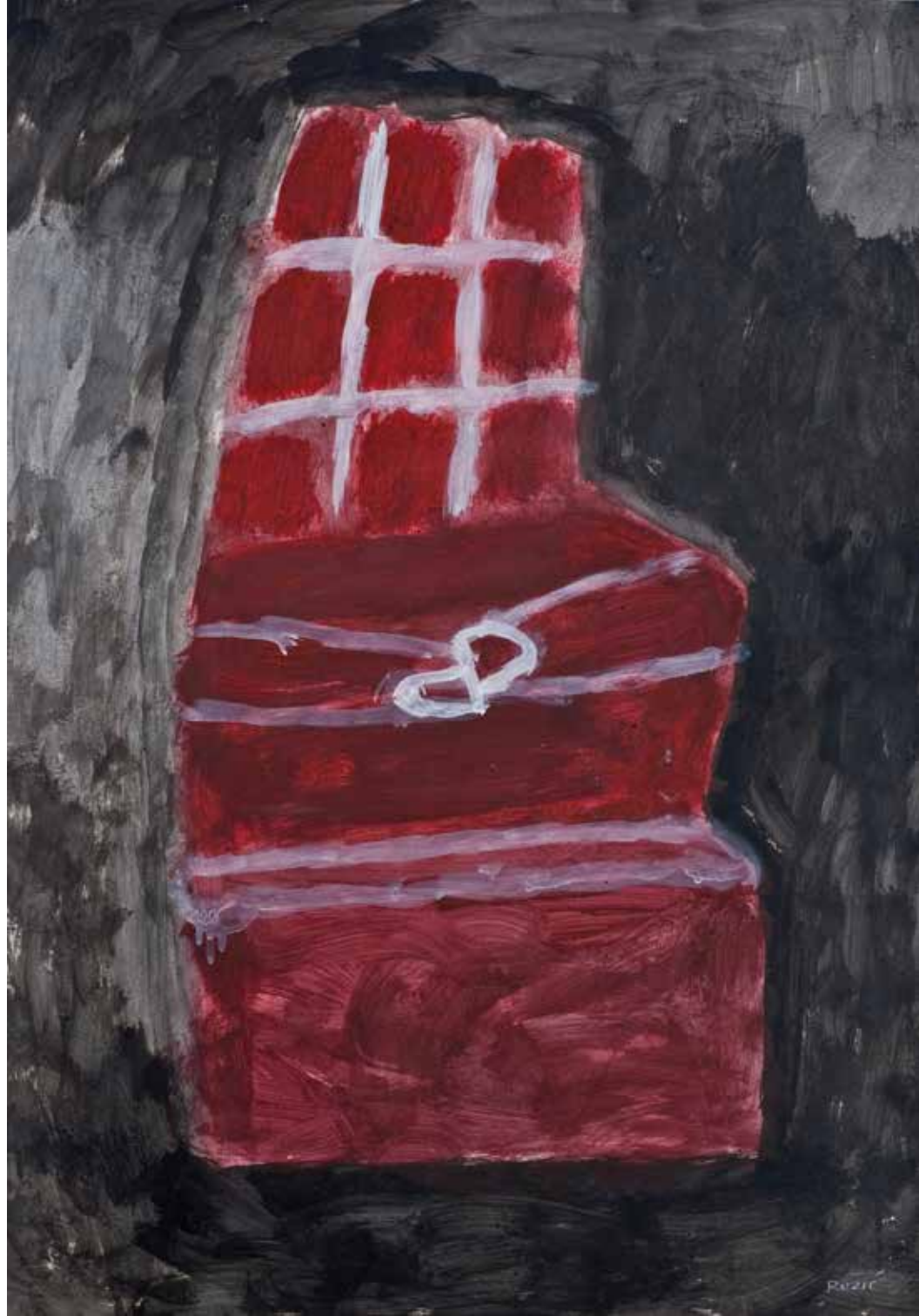
◀ RUKA I, 1993/94, gvaš, 71 x 50 cm