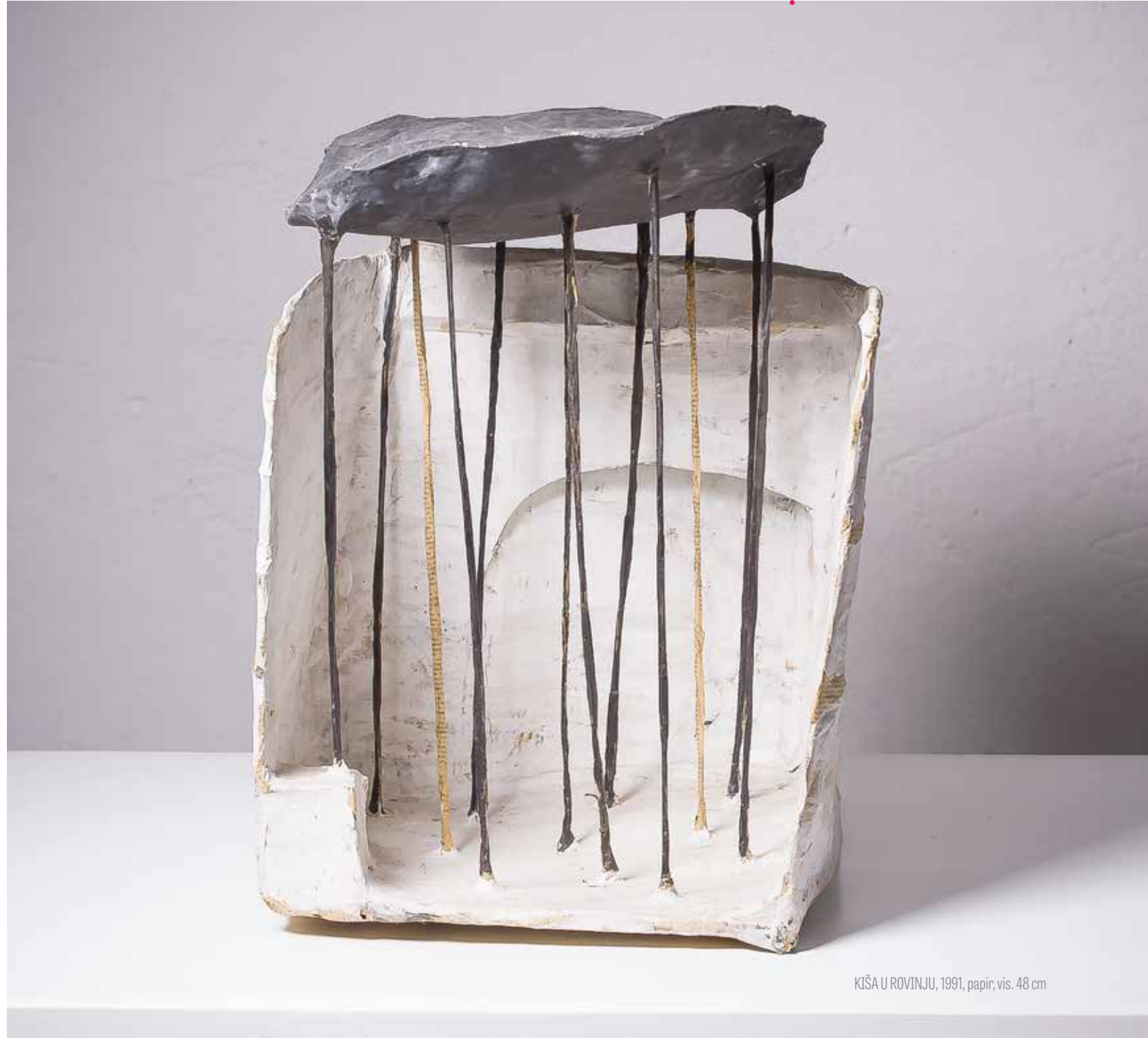
KIŠA U ROVINJU, 1991, papir, vis. 48 cm