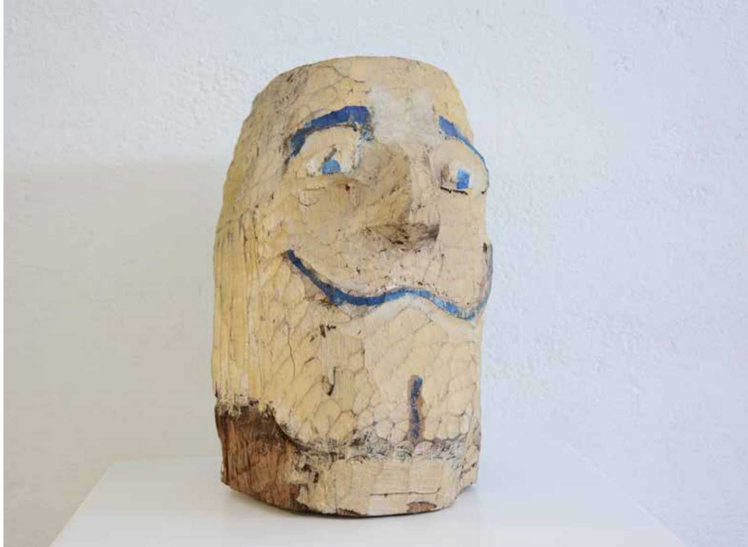
DALI, 1988, drvo, vis. 33 cm