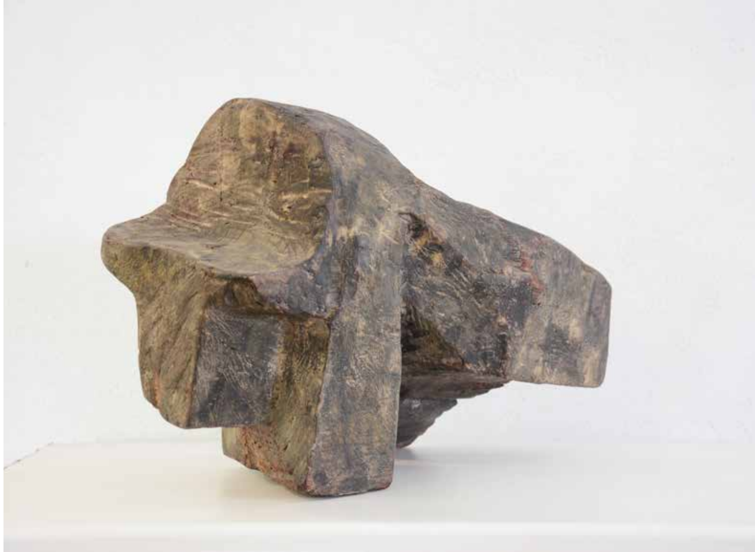
GRBAVI BIK, 1978, drvo, duž. 44 cm