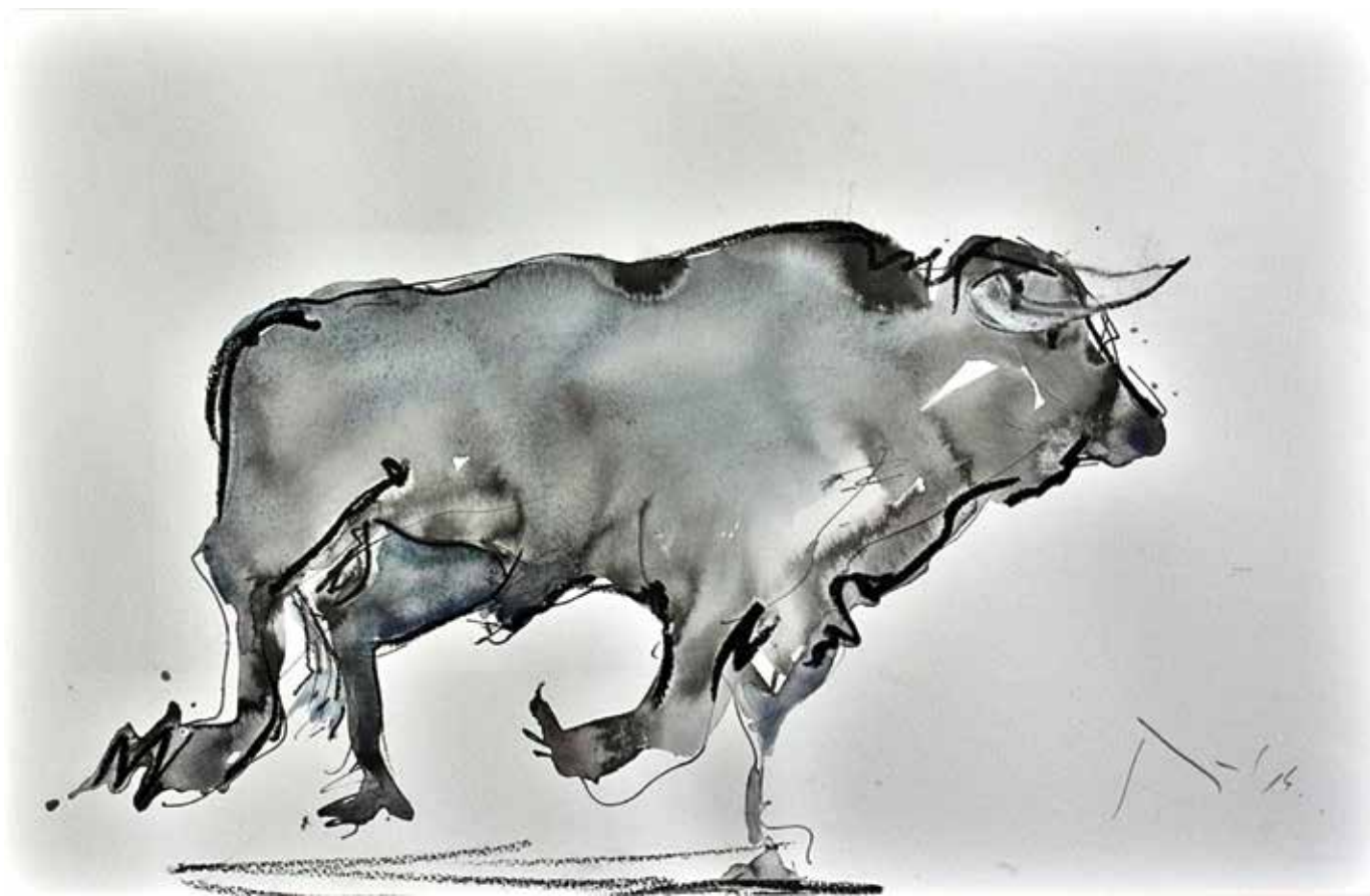
Stjepko Rupčić: Bik , akvarel na papiru, 32,5 x 50 cm, 2014.