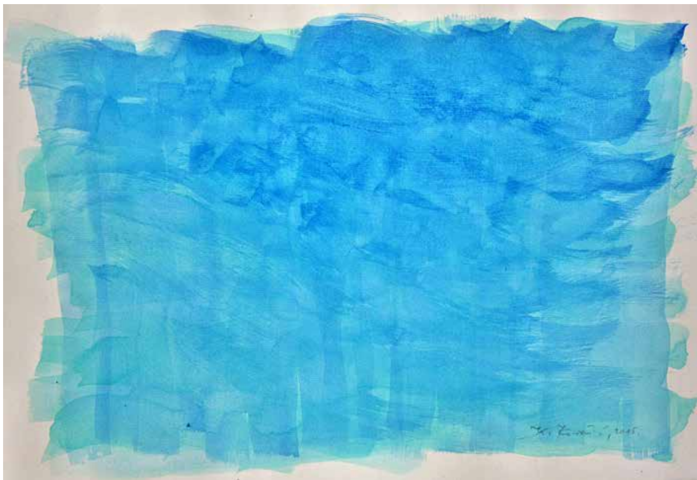
Kuzma Kovačić: Plićak , akvarel na papiru, 21 x 29 cm, 2015.