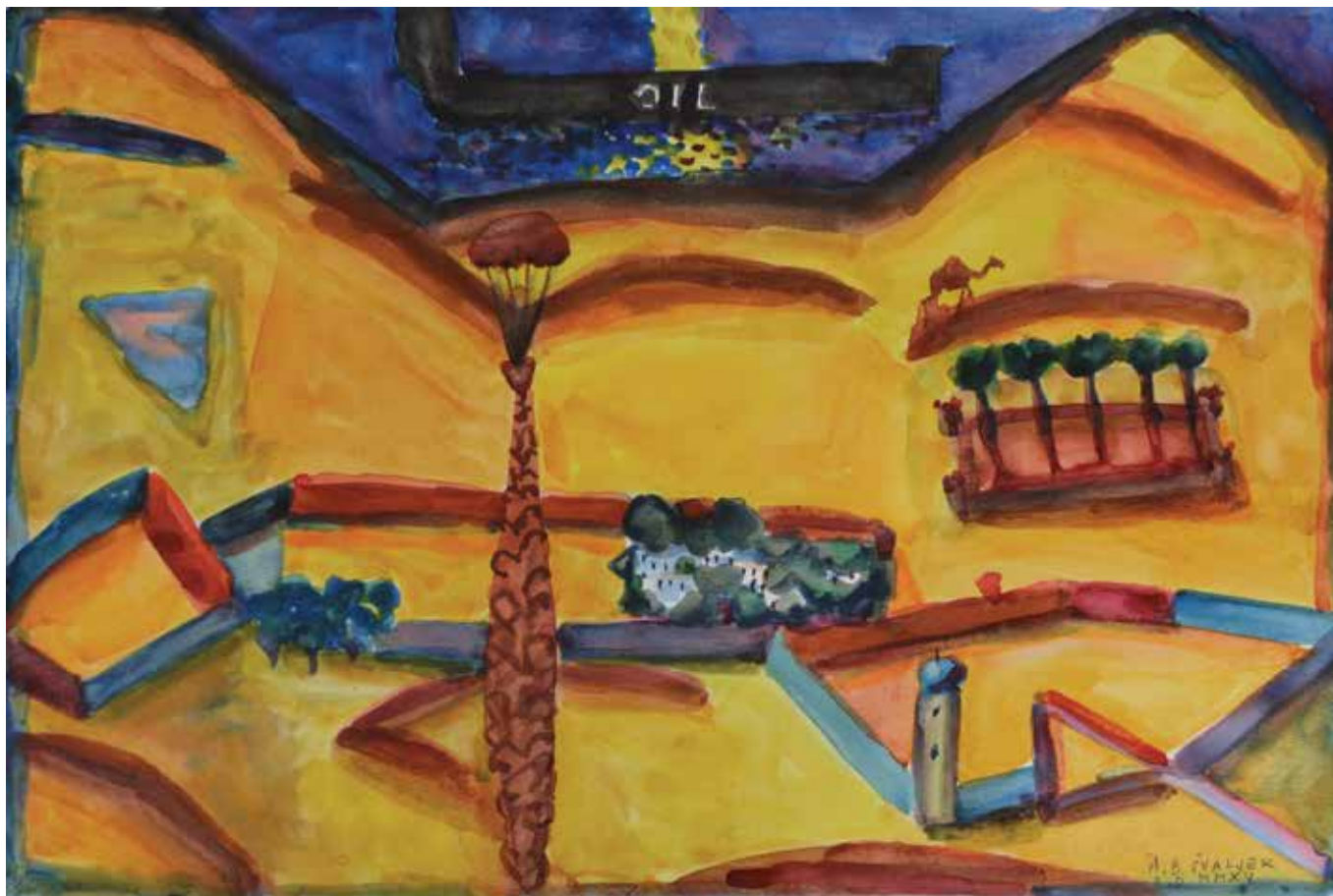
Antun Boris Švaljek: Nafta me nadahnjuje (P. Kleeu u spomen) , akvarel na papiru, 50 x 70 cm, 2015.