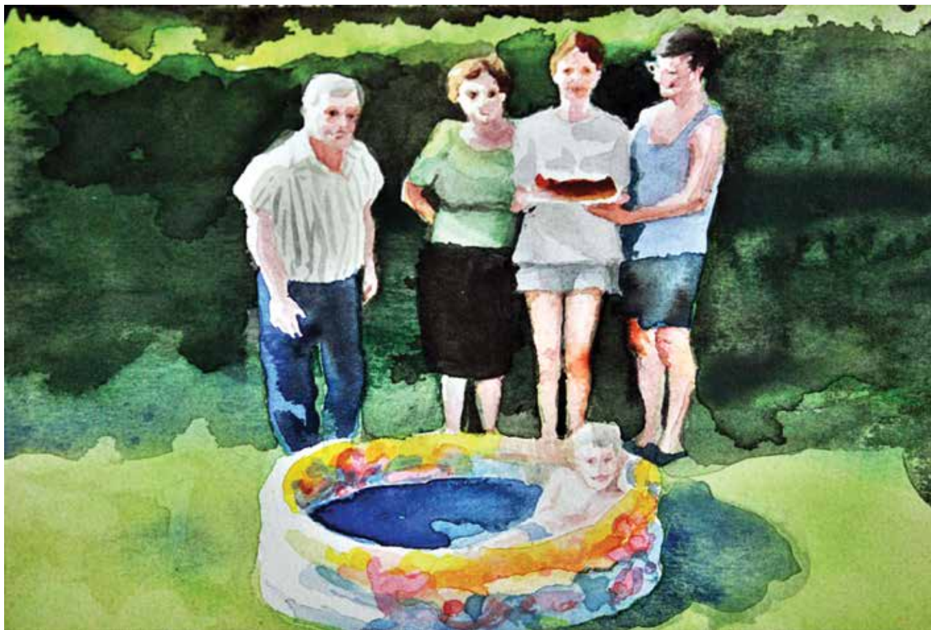
Amalija Albaneže: Bez naziva , akvarel na papiru, 13,5 x 14,5 cm, 2015.