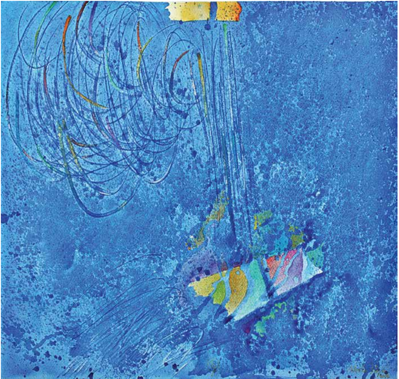
Mirko Stojić: Dolazak svjetlosti , akvarel na papiru, 52 x 54 cm, 2014.