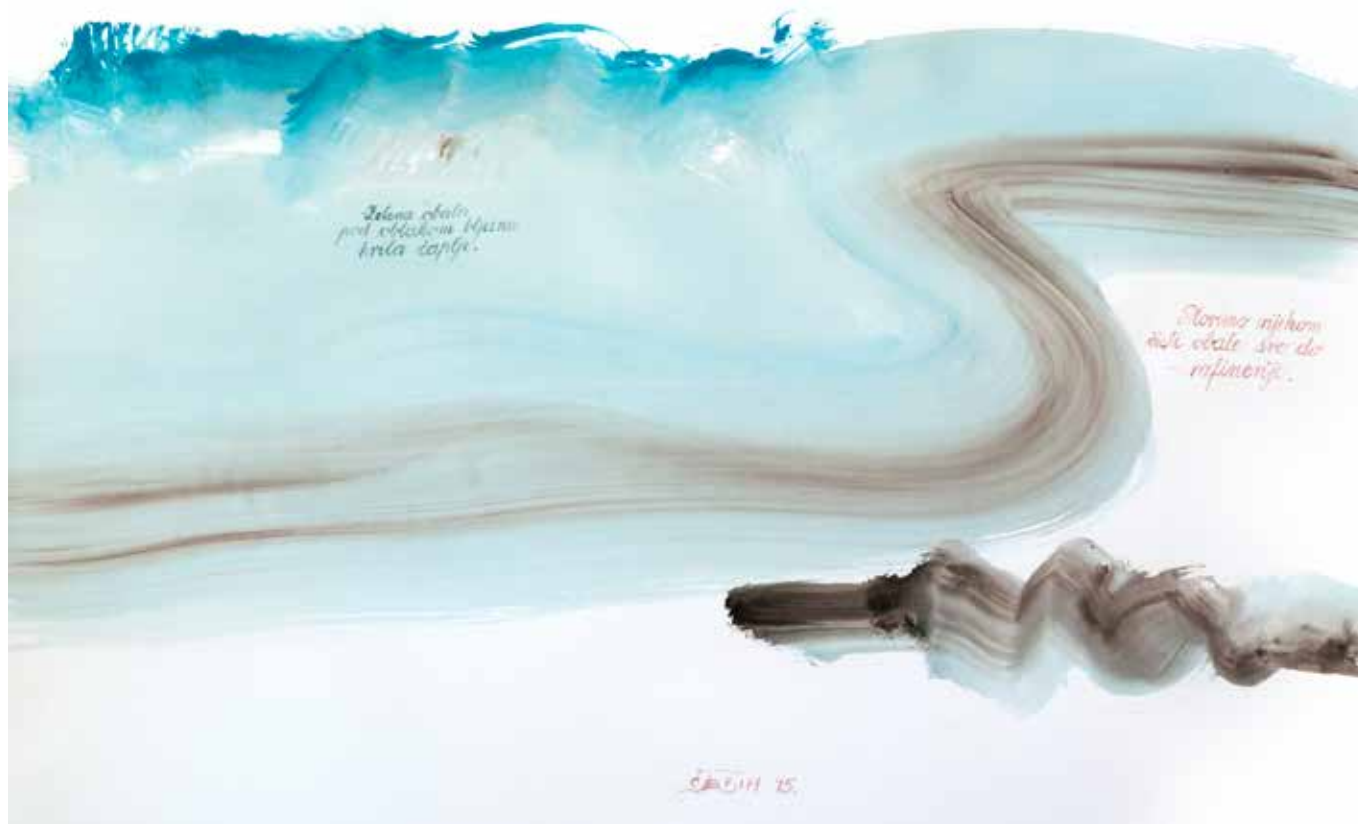
Mihael Štebih: Krila čaplje kraj rafinerije , akvarel na papiru, 111 x 91,5 cm, 2015.