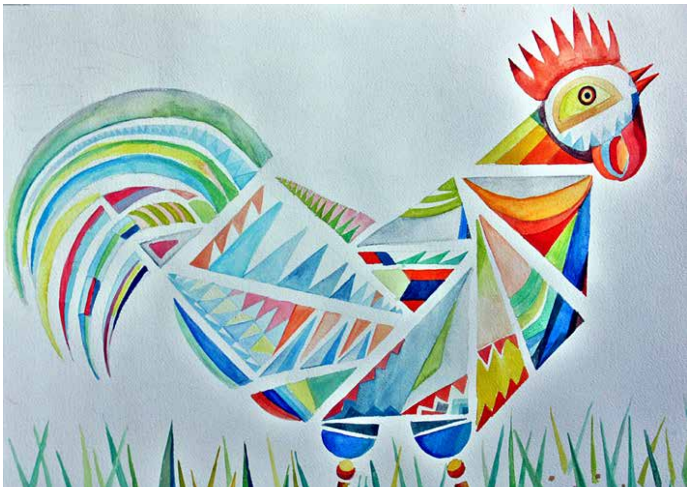
Ksenija Filipović: Pjevac , akvarel na papiru, 56 x 69 cm, 2015.