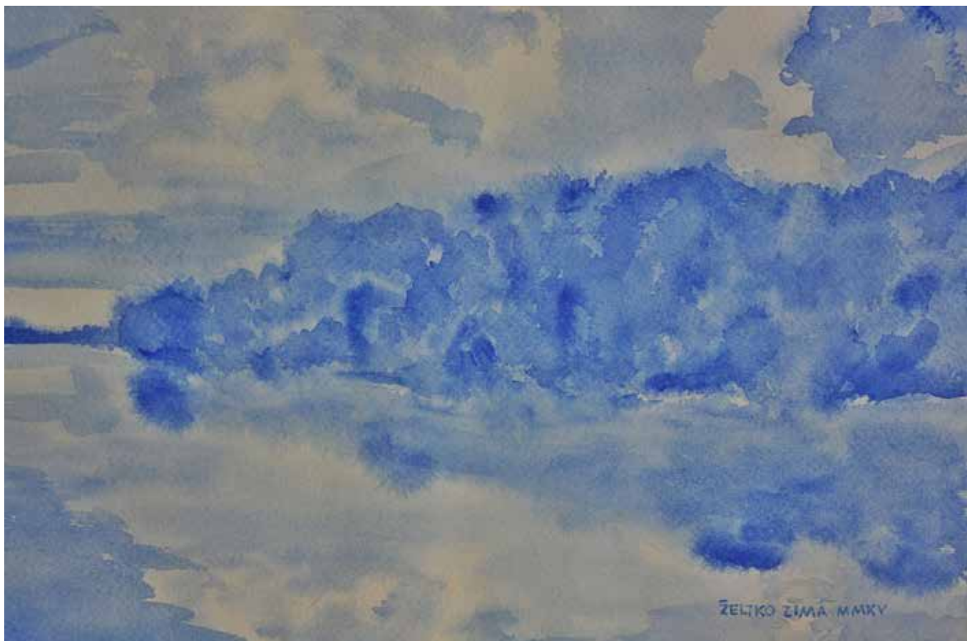
Željko Zima: Savska rapsodija , akvarel na papiru, 22,5 x 29,5 cm, 2015.